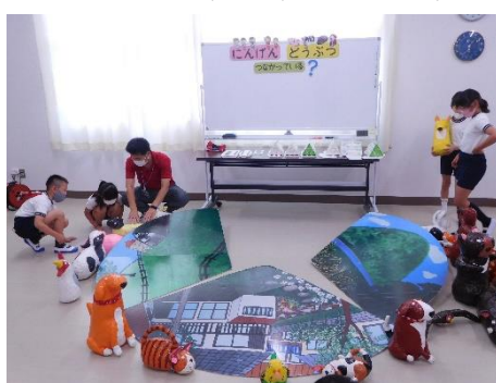
家畜、ペット、野生動物に分類しよう