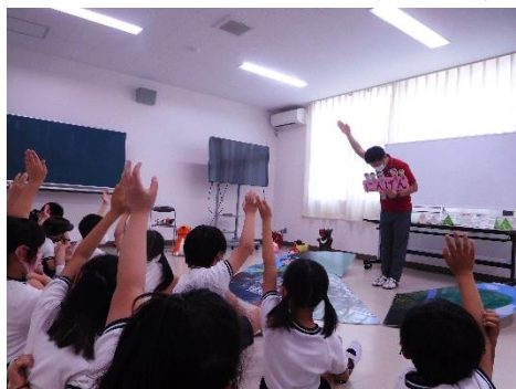
人間と動物はつながってる？

うだアニマルパークから先生に来ていただき、生き物と命について考える学習をしました。