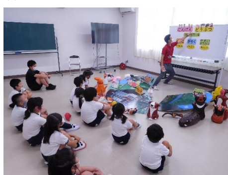
人間と動物の幸せな関係って？