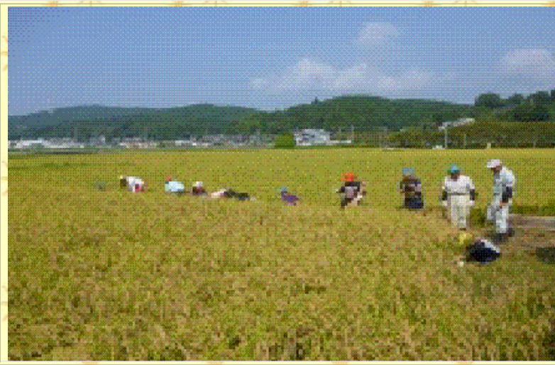
さあ、稲刈りがんばるぞ！