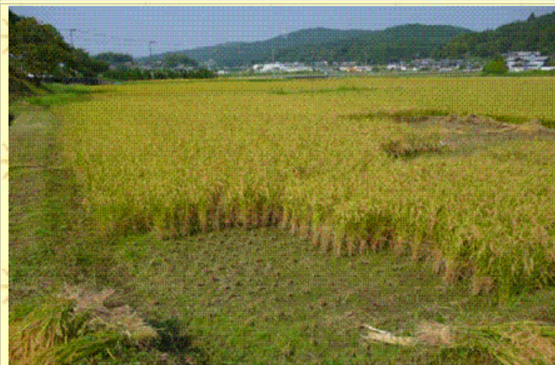
半分終了！まだまだあるぞ！