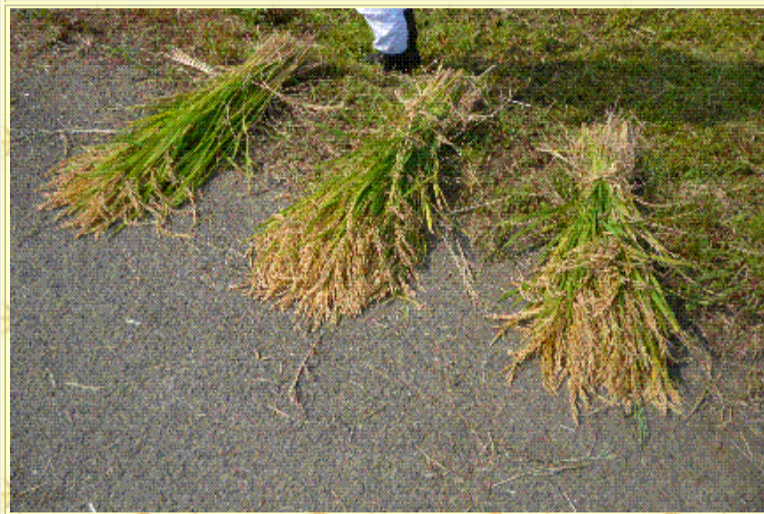
刈り取った稲をまとめていこう！