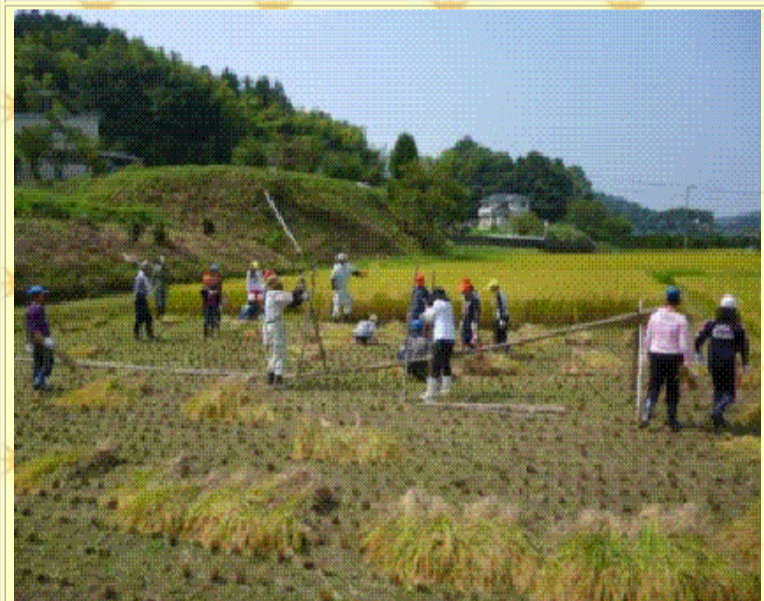
集めた稲を干す準備をしよう！