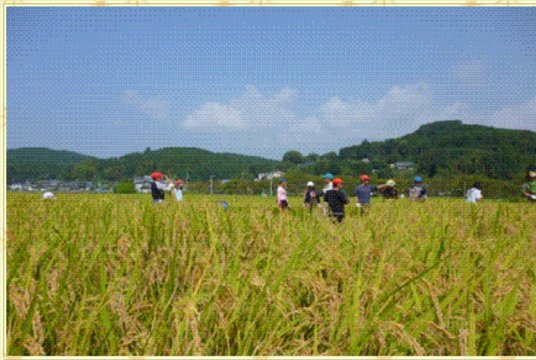
稲も立派に育ちました！