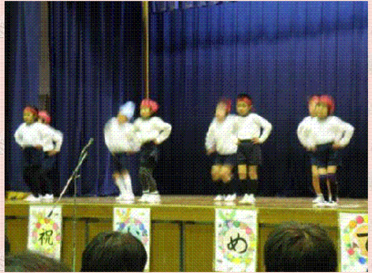
ダンス 祝卒業・勇気100%