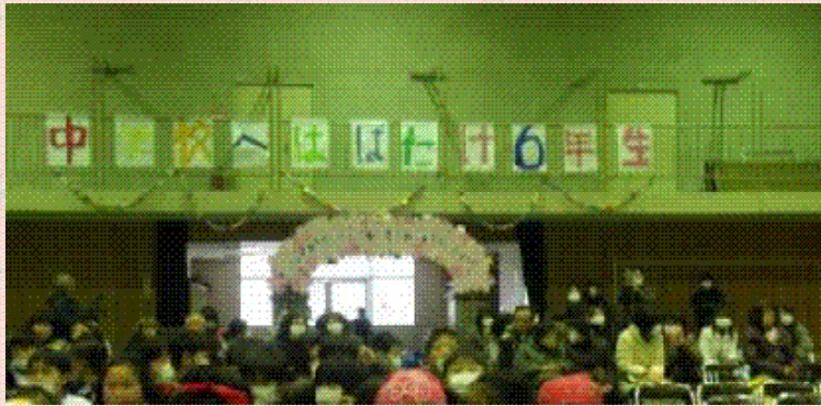
中学校へはばたけ6年生

インフルエンザや、体調を崩して欠席をしている児童は残念でしたが、6年生にとって思い出に残る送る会となりました。見に来ていただいた保護者のみなさんありがとうございました。