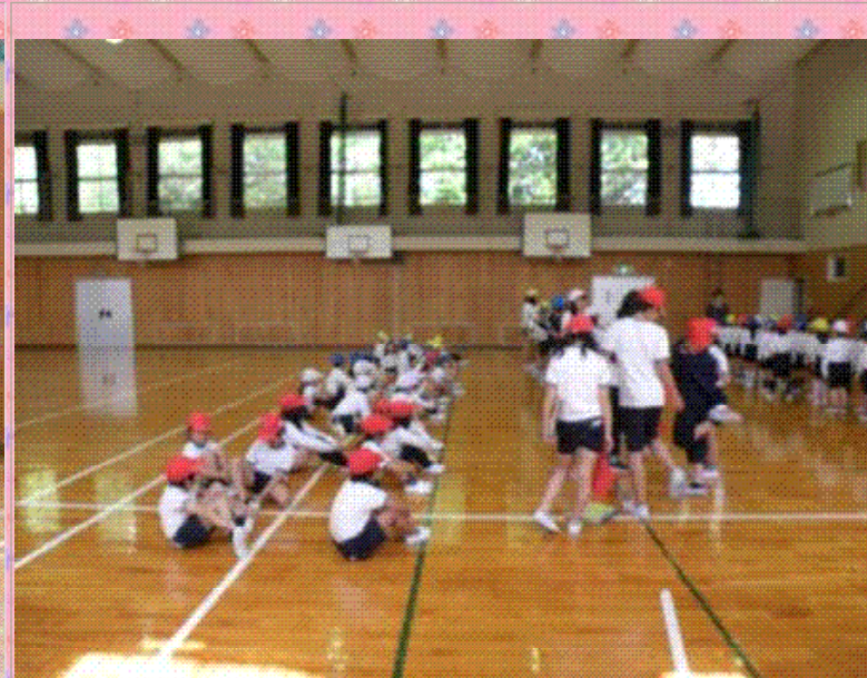
班ごとに各教室へ出発